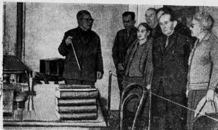
На снимке: экскурсанты в комнате В. И. Ленина.

За один только год музей посетило около 50 тысяч человек.