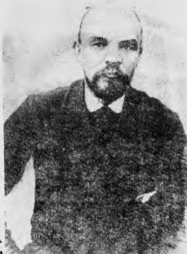
В. И. Ленин (1914 г.). Закопане.