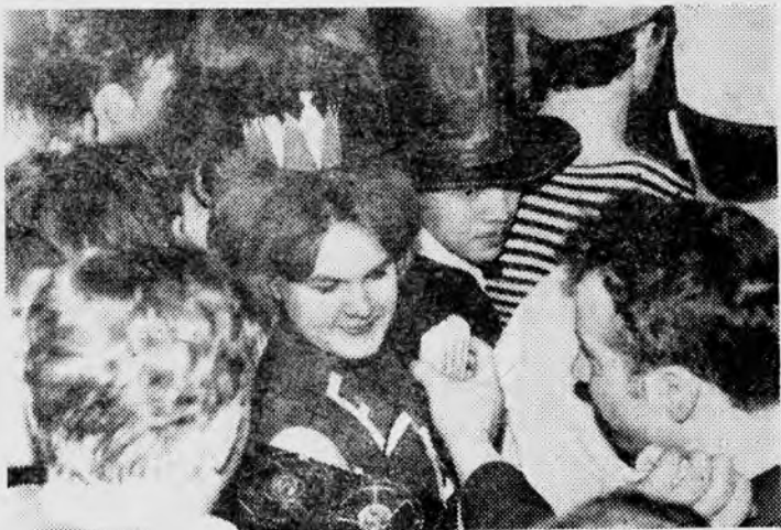
В пути. «Посвящение в европейцы». «Европа» дает интервью.

85 м высота, меч длиной 29 м, общий вес — 8 000 тонн. Вид ее строг, она зовет на защиту Отечества. И если нужно, мы пойдем за тобой, Родина-мать!