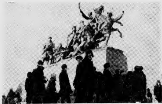
г. Куйбышев. Памятник В. И. Чапаеву.