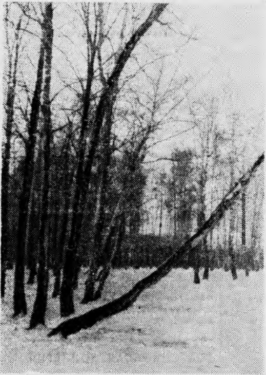
Студенческий городок. Март.

Опыты, проведенные профессором Герти Дукером, показали, что к красному цвету глаз быка совершенно не чувствителен. И атаковать алую мулету или красное платье его заставляет не цвет, а угрожающее движение ткани. К неподвижным поверхностям красного цвета он равнодушен.