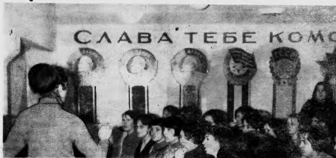
На всех факультетах идет подготовка к смотру художественной самодеятельности. На снимке вы видите репетиции хора девушек электротехнического факультета.