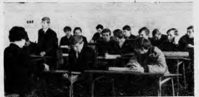
Идет сдача Ленинского зачета.

Популярность и массовость Ленинского зачета раскрывают высокую степень сознательности, политической зрелости нашего поколения, для которого ленинизм — и высочайший авторитет, и надежное оружие, и знамя борьбы. В важнейшем партийном документе — Тезисах ЦК КПСС «К 100-летию со дня рождения В. И. Ленина» говорится: «Трудолюбие, жажда знаний, идейная убежденность, патриотическая самоотверженность и интернационализм —