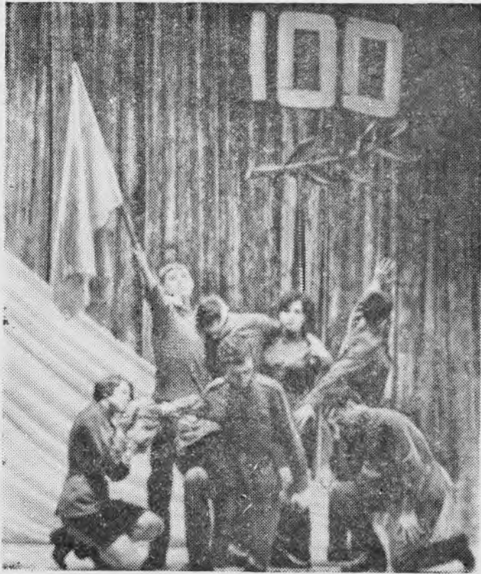
Хореографическая композиция «Памятник» в исполнении студентов теплоэнергетического факультета.