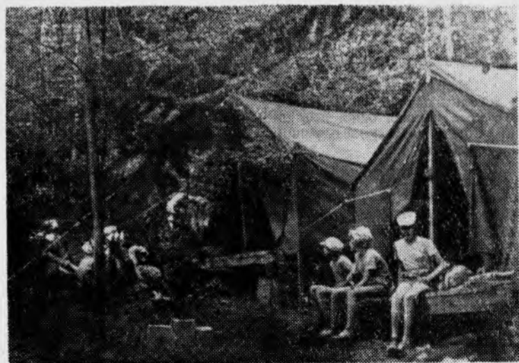
Летние каникулы проводим в спортивном лагере на берегу моря.