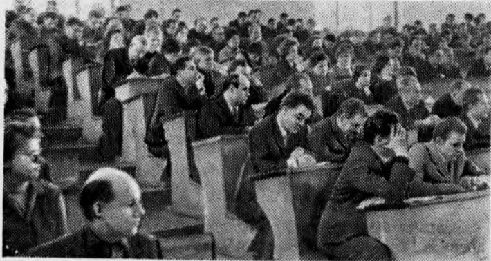
На общеполитинститутском партийном собрании.