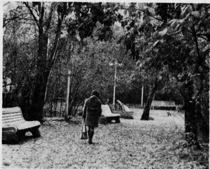
«Осенний мотив».