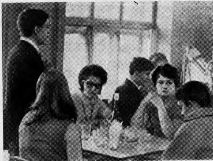
На снимке: на вечере в кафе «Орбита».