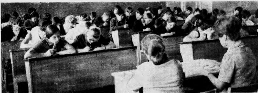
Идет письменный экзамен по математике.

да, их выпуск совпадает с окончанием девятой пятилетки и все, чего достигнет наше государство за эти годы, будет отдано под начало в умелые руки нынешних первокурсников».