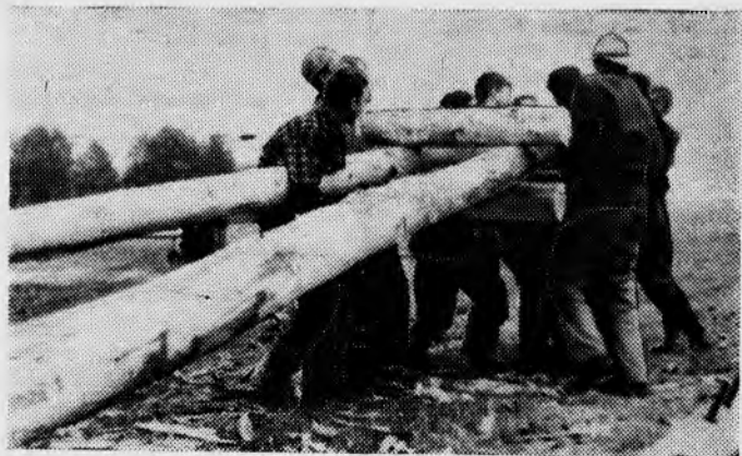
Бойцы отряда «Энергия» на строительстве линии электропередач (устанавливают анкер).

5. Утверждаются специальные стенды и книга социалистического соревнования. На стенд помещаются фотографии декана, руководителей общественных организаций лучшего факультета; заведующих, парторгов и профоргов лучших кафедр; старост, комсоргов, профоргов лучших академических групп; групповые фотографии членов лучших кафедр и академических групп с перечислением фамилий. На стенде также отражаются численные показатели лучшего факультета, лучших кафедр и академических групп. Эти материалы вносятся в книгу социалистического соревнования, которая со временем должна стать документом, отражающим в исторической последовательности результаты работы подразделений института. Книга хранится в ректорате или в профкоме института.