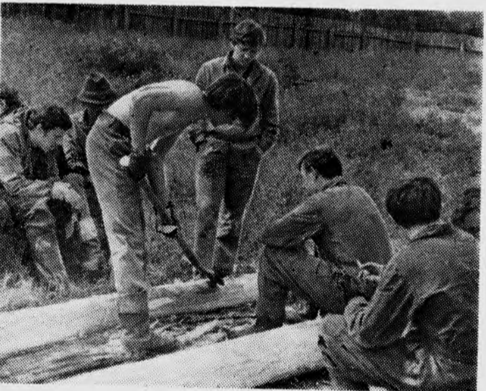
Когда одна лопата...