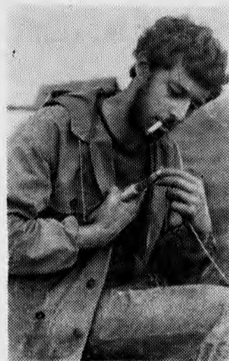
Петли делать — тоже работа.