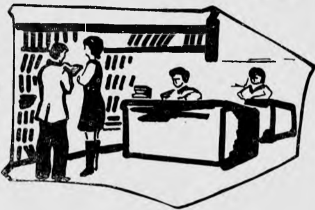
Рис. В. Вершинского (гр. 311-6).