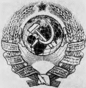
Герб Союза Советских Социалистических Республик, утвержденный 2-й сессией ЦИК СССР 6 июля 1923 года в Москве.

В. И. Ленин подчеркивал важность соблюдения принципа равноправности всех союзных республик в руководстве ЦИК. Делегаты съезда одобрили положения Ильича. Первыми председателями Центрального Исполнительного Комитета были избраны: М. И. Калинин — от РСФСР, Г. И. Петровский — от УССР, А. Г. Червяков — от БССР и Н. Н. Нариманов — от Закавказской Федерации.