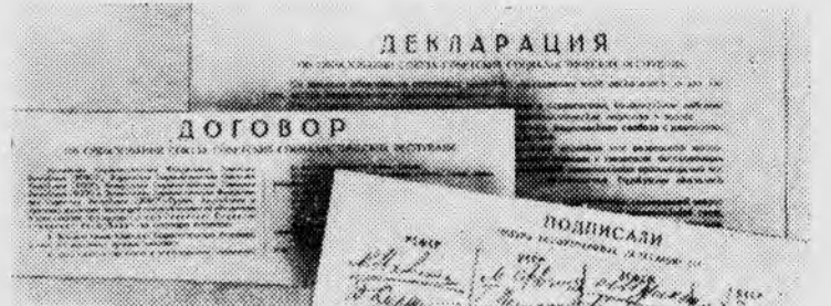
Декларация и Договор об образовании СССР, подписанные 30 декабря 1922 го-

Завоевание СССР — это и взаимная радость при подведении итогов успешного развития братских республик, и взаимная помощь, сотрудничество. Выступая на торжественном заседании в Тбилиси, посвященном 50-летию Грузинской ССР, Генеральный секретарь ЦК КПСС товарищ Л. И. Брежнев говорил: «Все мы, в какой бы республике мы ни жили, — советские патриоты, дети одной социалистической Родины. Наша родная земля, Отчизна наша — это необъятные просторы, раскинувшиеся от Тихого океана до Балтийского моря, от Северного Ледовитого океана до Пами-