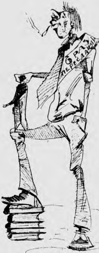
Чемпион по пересдаче.