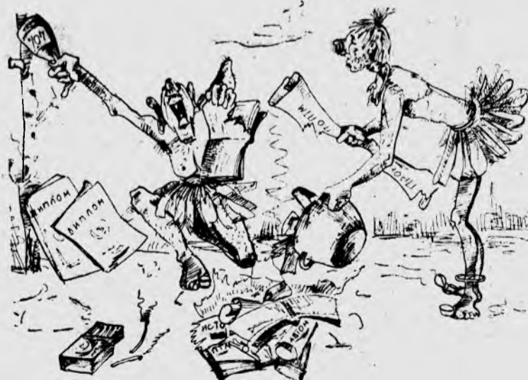
Рисунок Валерия КОВАЛЕВА.

Нам понятна радость по поводу окончания учебы в институте, но, товарищи, давайте не будем нынче такими дикарями, найдем способ культурно и красиво отметить это замечательное, торжественное событие.