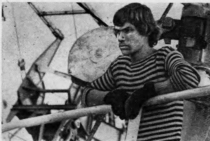
Стремится к океану Енисей. Искры в солнечных лучах волны. Уходят в дальний путь суда... Хорошо думается здесь, на краю земли, о жизни. Как важно прожить ее так, чтобы остался на земле и твой след. Тому из наших стройотрядовцев, кто работал нынче в Игарке, лето подарило немало прекрасного.