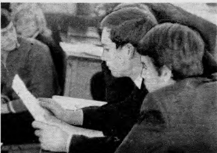
Пришел свежий номер «Политехника».