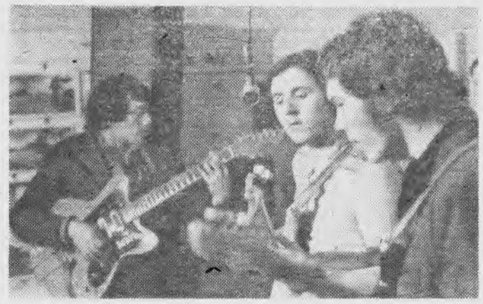
Вокально-инструментальный ансамбль «Радуга» электротехнического факультета подготовил интересную новогоднюю программу.