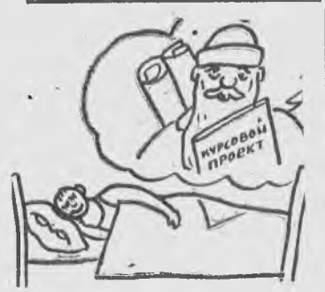
Сон в новогоднюю ночь. Рисунок студента В. Гончарука.