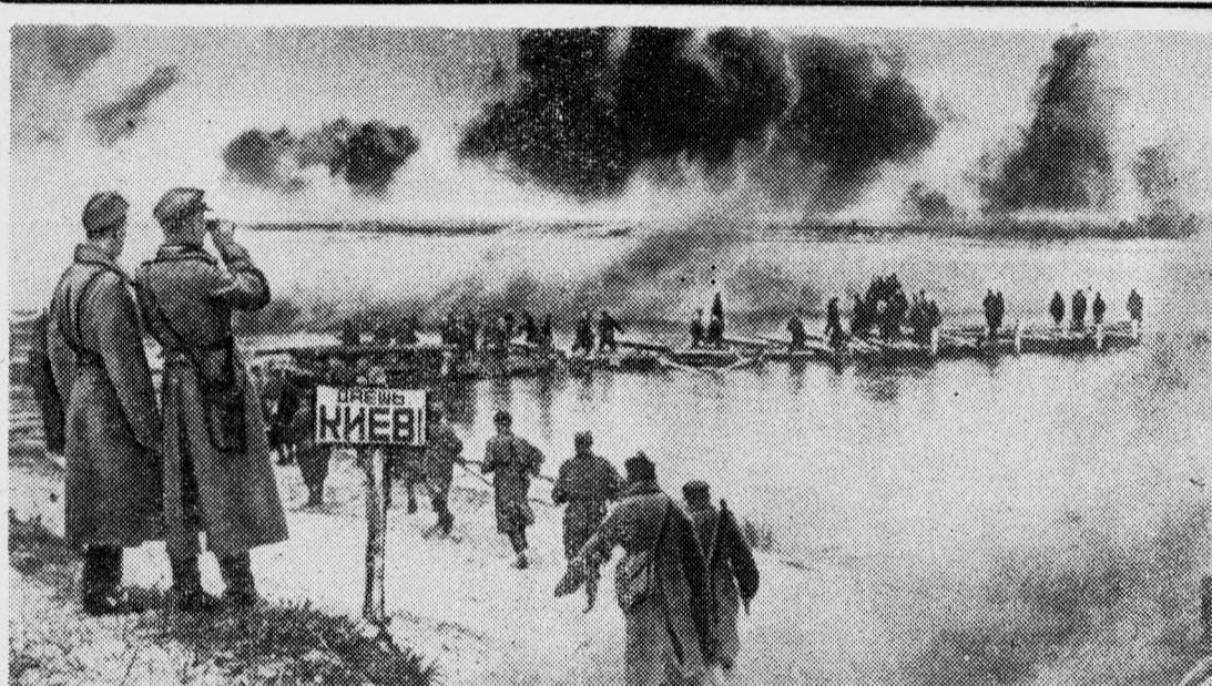
Битва за Киев.

В. МАЛЮГИН, преподаватель кафедры философии, наш корр.