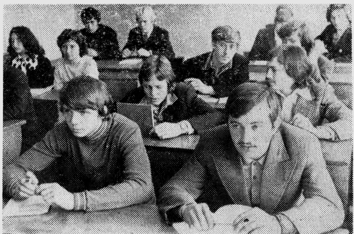
НА СНИМКЕ: Первокурсники на одной из первых лекций.

В. КУПРИЕНКО, студент 2-го курса ЭТФ, наш корр.