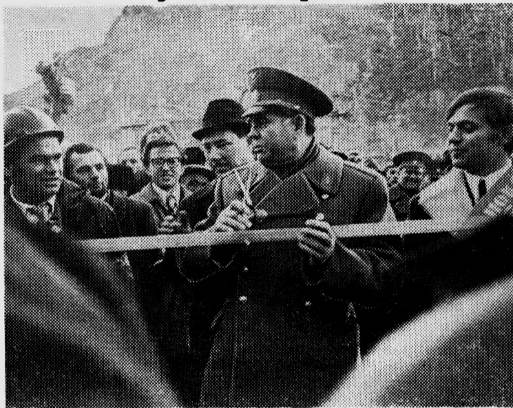
НА СНИМКЕ: Летчик-космонавт СССР Г. Т. БЕРЕГОВОЙ разрезает ленту. Начинается штурм Енисей!

бе место на самом краю левого берега. 15 тысяч людей собралось на сравнительно небольшом участке земли. Скал вокруг не было видно — люди забрались и туда. Недалеко от нас стоял огромный экскаватор. Понять, что это экскаватор, можно было лишь по очертаниям. Разноцветными заплатками казалась нам издали одежда людей, взобравшихся на экскаватор, чтобы