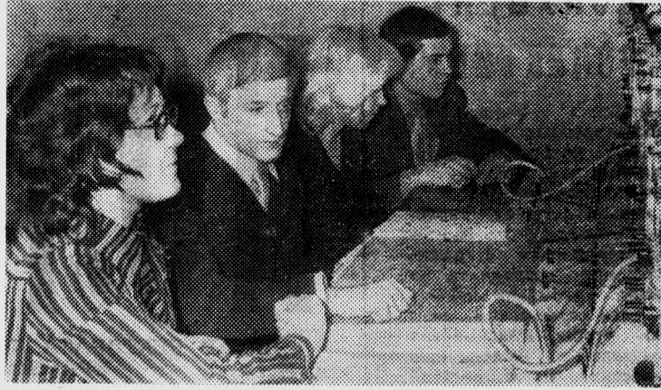
Успехами в учебе и труде встречает День энергетика победитель социалистического соревнования нынешнего года коллектив электротехнического факультета. Его отряд «Энергия» как лучший ССО края завоевал почетное право подписать Рапорт Ленинского комсомола XXV съезду КПСС. Студенты-электротехники успешно выступили недавно на Российской и зональной выставках научно-технического творчества молодежи. И успеваемость на факультете высокая. На снимках: на занятиях в лаборатории — будущие энергетика студенты группы 113-1.