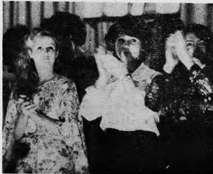
Занятия в художественной самодеятельности развивают в студентах чувство прекрасного, прививают умение общаться, воспитывают коллективистские качества, высокую дисциплину, организованность. Вот почему в нашем институте уделяется очень большое внимание развитию художественной самодеятельности.