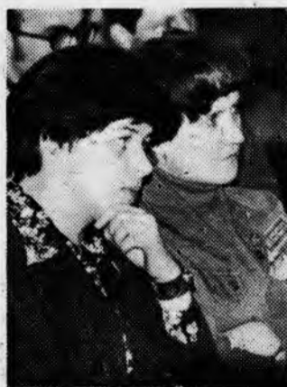
Сегодня в институте состоится митинг студенческих строительных отрядов.