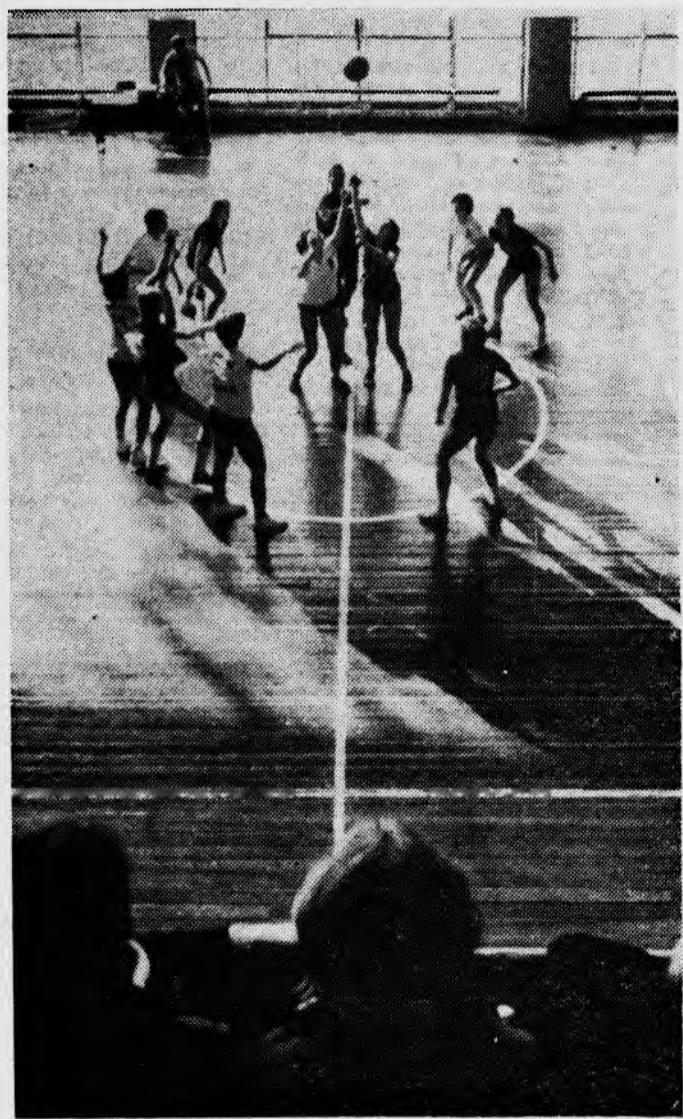
Команда баскетболисток института — победительница закончившейся недавно Политехнады Сибири и Дальнего Востока, и теперь она будет участвовать в финале первенства СССР среди политехнических вузов, который состоится в октябре в Ташкенте.