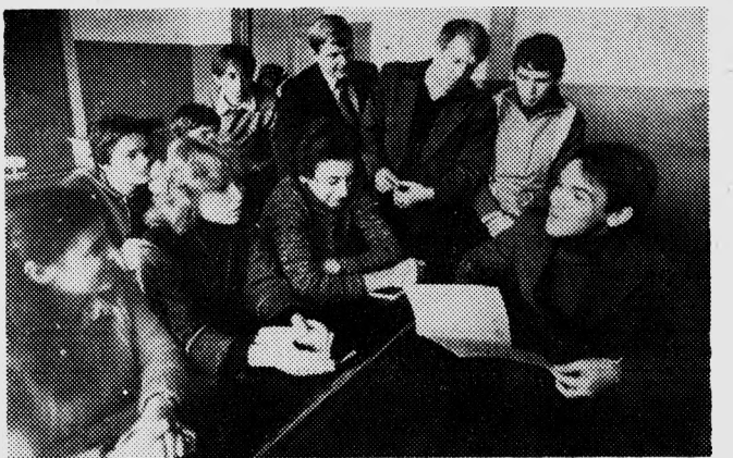
В группе — собрание.