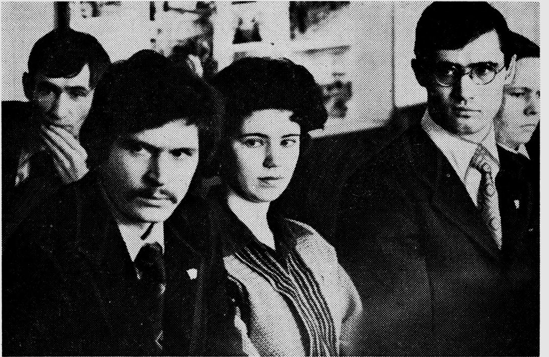
Студенчество нашей страны, вся молодежь горячо поддерживают решения XXVI съезда КПСС. Впереди сегодня — лучшие в учебе, труде и общественной деятельности. НА СНИМКЕ: комсомольские активисты института.