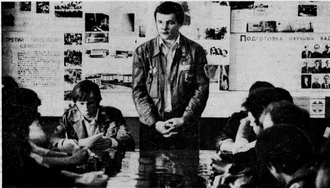
Идет заседание штаба третьего трудового.

Цель, которую преследовали организаторы соревнования — повысить активность линейных отрядов в подготовительный период — достигнута. И я думаю, что другим факультетам нужно поддержать ценную инициативу, учитывая свою специфику и проблемы. Только не надо сетовать на пассивность комсомольцев. Эта пассивность происходит от нежелания или неумения правильно организовать свою общественную работу. И если по-комсомольски подойти к делу, больше не придется возвращаться к этим вопросам, и недостатков в работе наших ССО заметно поубавится.