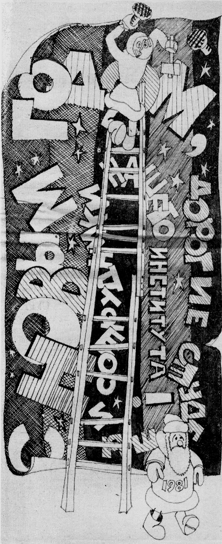
Рисунок М. МЕРКУЛОВА.