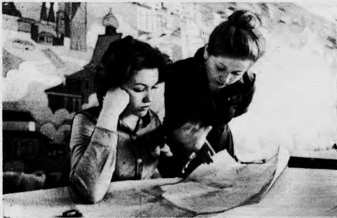
НА СНИМКЕ: студенты занимаются в читальном зале младших курсов библиотеки института.