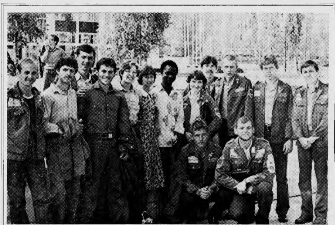
Бойцы отряда «Лэпия» во время интернациональной встречи со студентами из Москвы.

И ТАК, что можно сказать о работе отрядов в целом! Несмотря на недостатки, стала более четкой организация труда. Этому способство-