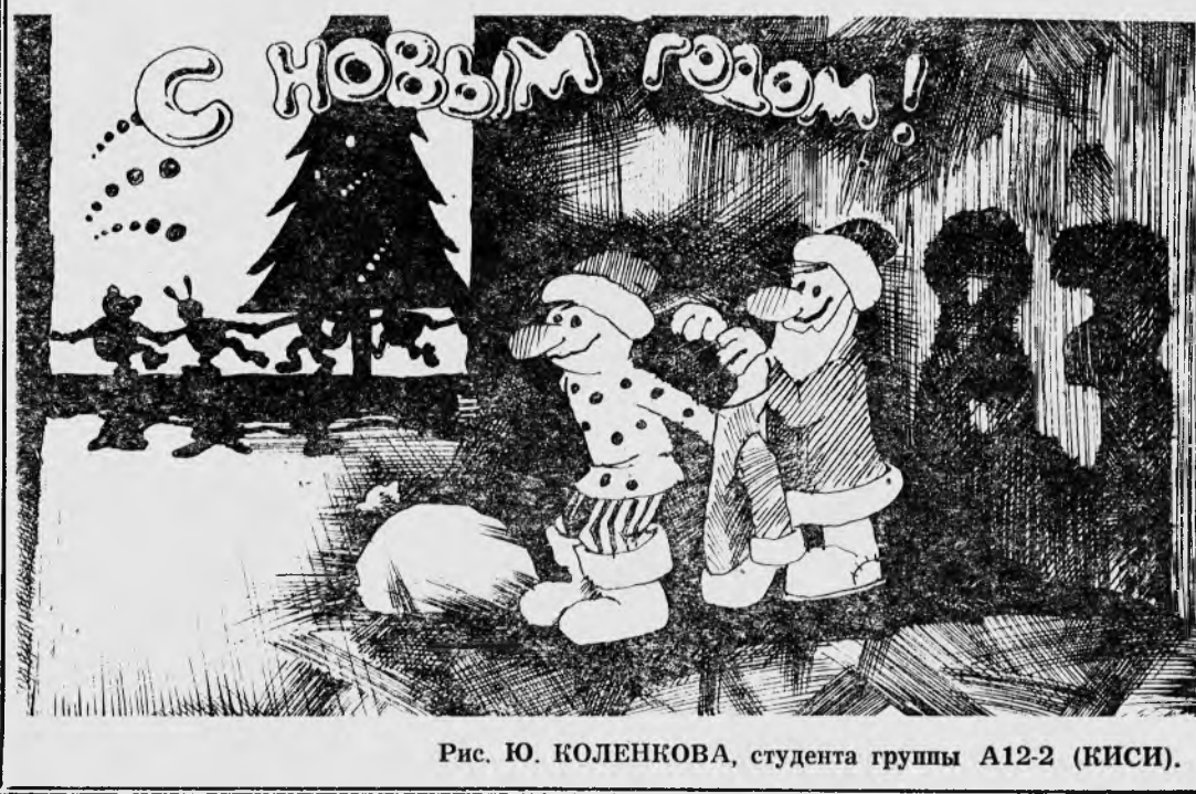
Рис. Ю. КОЛЕНКОВА, студента группы А12-2 (КИСИ).