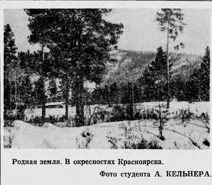
Родная земля. В окрестностях Красноярска.

— Буду готовиться к сессии, чтобы со мною случилось поменьше «смешных» историй.