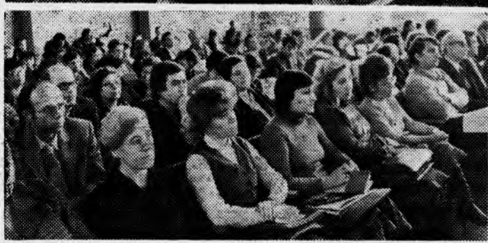
Сотрудники института — слушатели системы политического просвещения на первом занятии.