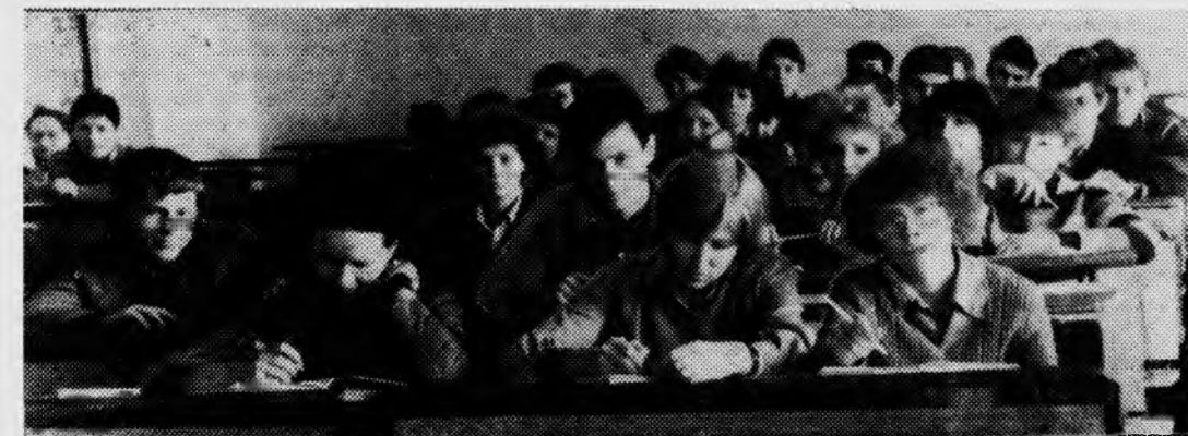
Наш труд — учеба