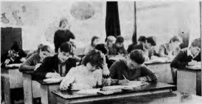
Нынче на электромеханическом факультете учатся две группы первокурсников, которые получают новую для на-