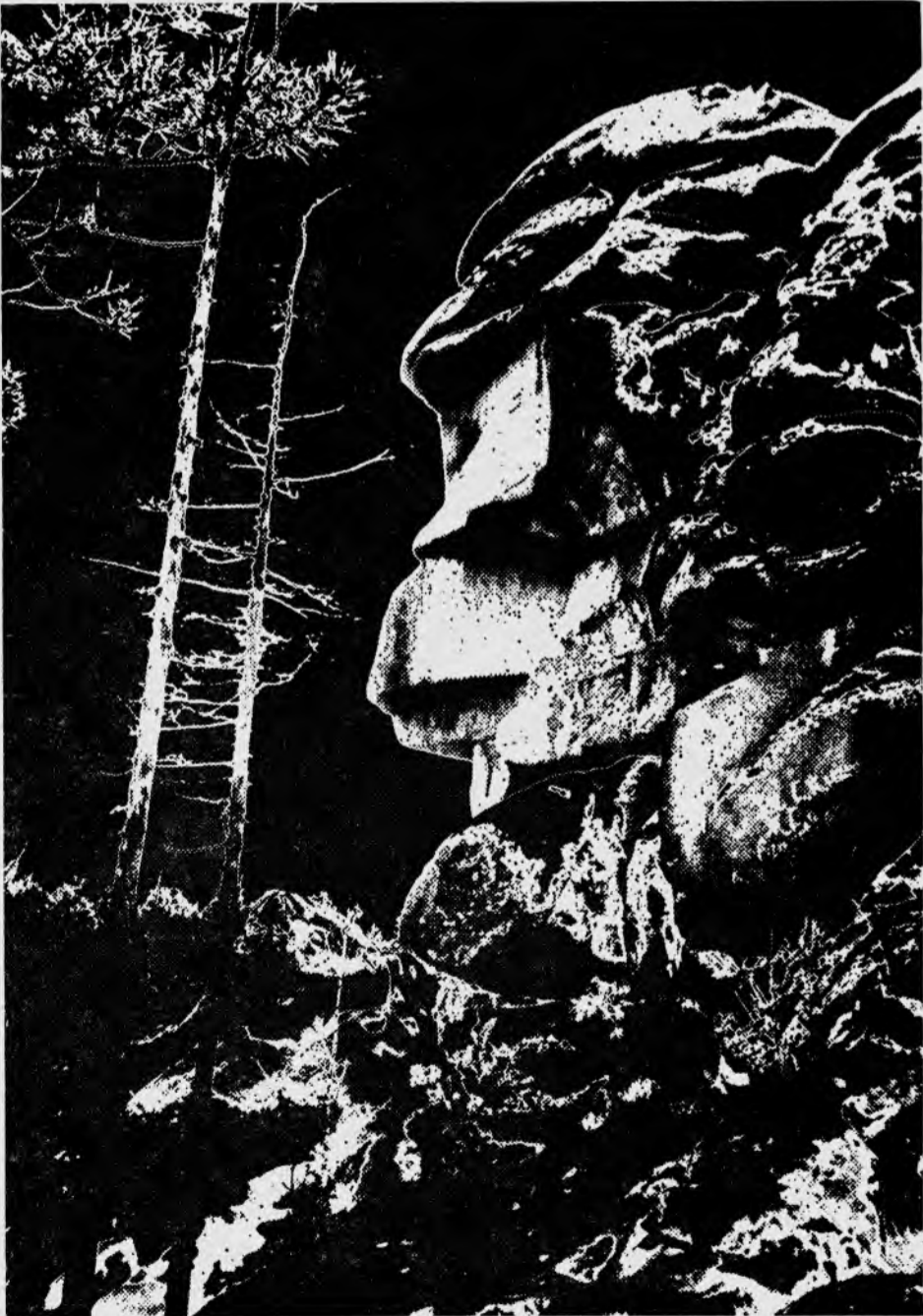
Скала «Дед» заповедника «Столбы» — излюбленное место отдыха красноярских туристов и гостей нашего города.

Многим ты послужила, Начата давно, Песенка для пассажиров, Выглянувших в окно. Диктор какой-то нудный Рядом с тобой живет: Еже-почти-минутно Режет тебя и рвет. Все же в транзитном зале Слушают не дыша. Музыка на вокзале! Значит, ты хороша. Значит, гудки не мешают Песне греметь с утра. Музыка, ты — большая. Музыка, ты — добра. Не уставай, работай! Век тебя слушать готов: Словно море у борта, Музыка вдоль поездов.