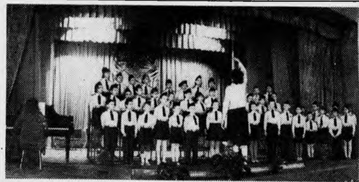
Перед ветеранами института выступает детская хоровая студия «Красная звезда» Академгородка (художественный руководитель Л. В. Русина).

И солнца луч, и снег, И ветер, И в стылых лужицах перрон. И только в сумрачности светел Усталый рельсов перезвон. И все становится незримым, И все как будто в немоте,