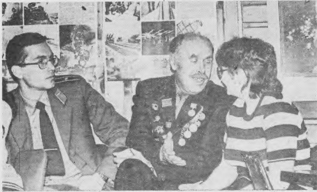
НА СНИМКЕ: председатель совета ветеранов КПИ, старший преподаватель кафедры полит-