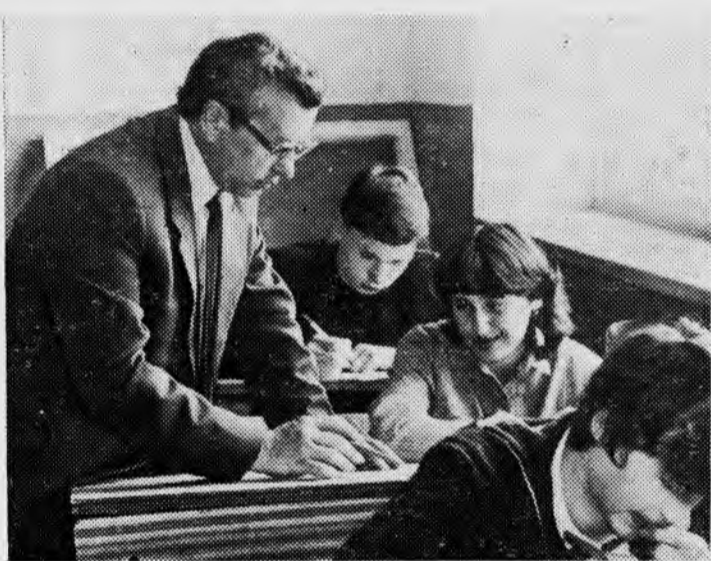
У первокурсников 23 июня закончилась весенняя экзаменационная сессия. Впереди — летние каникулы, ра-

Молодежь Страны Советов решительно выступает против гонки вооружений и производства оружия массового уничтожения, идет в авангарде борцов за разоружение. По инициативе ВЛКСМ в июне 1985 года в Москве состоится XII Всемирный фестиваль молодежи и студентов под девизом «За антиимпериалистическую солидарность, мир и дружбу». Нынешний год провозглашен ООН годом молодежи.