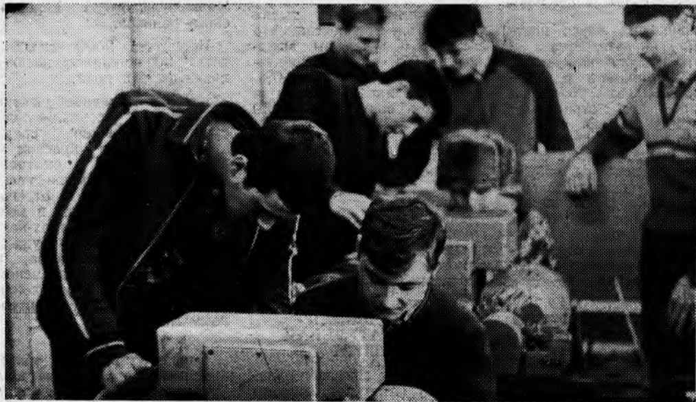
Студенты машиностроительного факультета выполняют лабораторные работы в лаборатории передач, валов и муфт кафедры деталей машин.