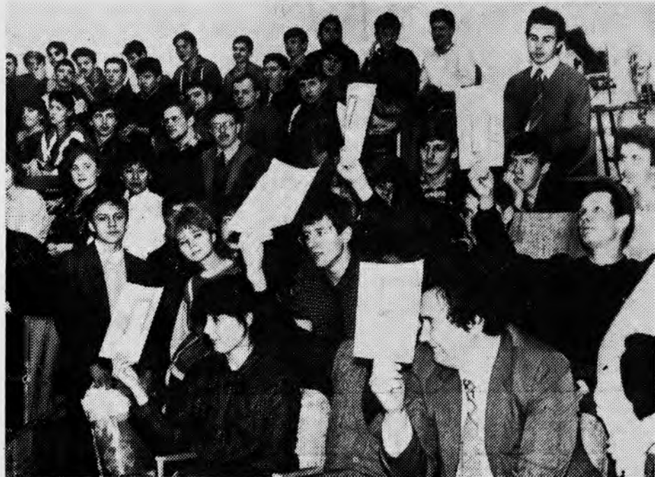
Интересно прошла неделя радиотехнического факультета. Студенты и преподаватели много энергии и выдумки отдали запланированным мероприятиям. Фоторепортаж о проведении КВН читайте на 3-й стр.

Ю. ПЕРФИЛЬЕВ, зам. председателя МСИ, зав. кафедрой ТОЭ.