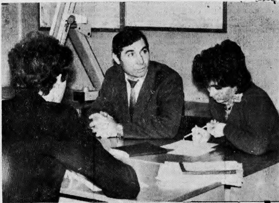
В институте в самом разгаре сессия. Заканчивается зачетная неделя. Наш корреспондент зашел в аудиторию, где принимался зачет по при-

кладной механике и задал вопрос: «Лучше или хуже сдают студенты сессии по сравнению с предыдущими?»