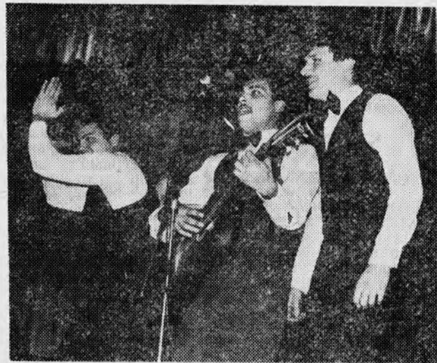
вы у нашей команды! НА СНИМКАХ: видеоклип команды КрПИ; «самоуправление — мать по-

Зрители — болельщики с восторгом приветствовали все удачные «выходки» своих команд. Только в одном из видов программы наша команда проиграла «лясотехникам». КВН закончился со значительным преимуществом «смехаников». Чаяния болельщиков оправдались, но, по их же мнению, есть еще резер-