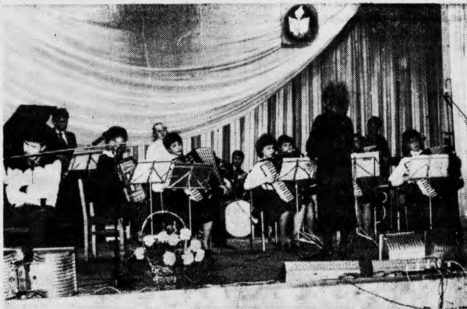
Инструментальный ансамбль института.

МВД СССР сообщает: разбойные нападения на дома и квартиры ежегодно обходятся советским людям в 10—15 млн. рублей, за шесть месяцев этого года совершено 1.054 преступления такого рода, из них раскрытых — 66,1 процента.