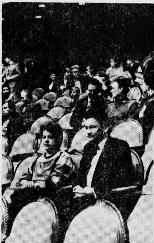
Кафедра этики, эстетики и культуры приобрела абонемента на цикл концертов выдающихся исполнителей «Вечера инструментальной музыки».