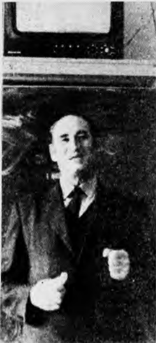
25 октября на конференции трудового коллектива института прошло обсуждение и одобрение положения об аттестации профессорско-преподавательского состава по занимаемой должности.

В положении основное внимание уделено порядку аттестации, то есть как, а не что аттестовать. Фактически по этому положению никакой аттестации быть не может, так как фонд зарплаты на кафедры рассчитывается, исходя из существующего штатного состава по средним ставкам должностных окладов. В результате этой операции, видимо, допустимо очень малую часть зарплаты взять у одного преподавателя и отдать другому. Можно прогнозировать с высокой вероятностью, что на такую акцию кафедры не пойдут и оставят все так, как предложит планово-финансовый отдел (естественно, по предложению администрации). И это еще не все. Институт, оформив большое количество формальных бумаг, практически на три-пять лет теряет право проведения настоящей аттестации.