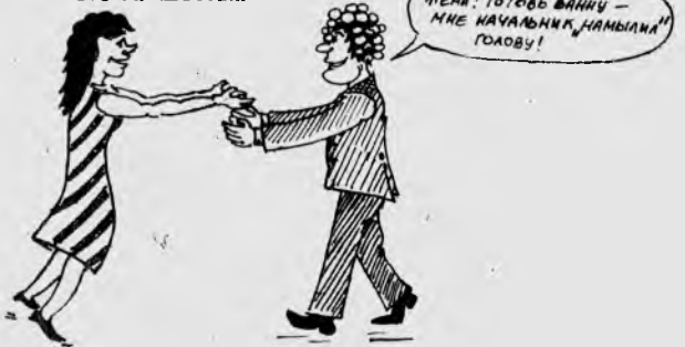
рисунки студента ФАВТ Олега Чеботько.