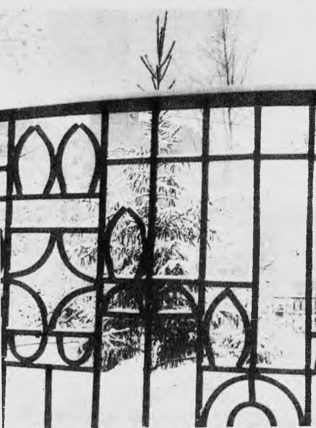
Фоторепортаж студента МТФ Максима Санникова.