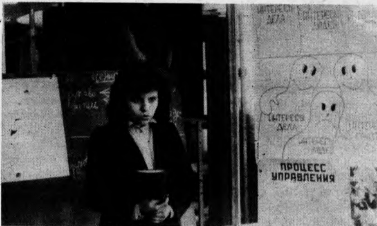
Интеллектуальный шоу по проблемам межличностных отношений выявило немало ярких талантов среди студентов экономического факультета. Репортаж об этом читайте на 2-й стр.