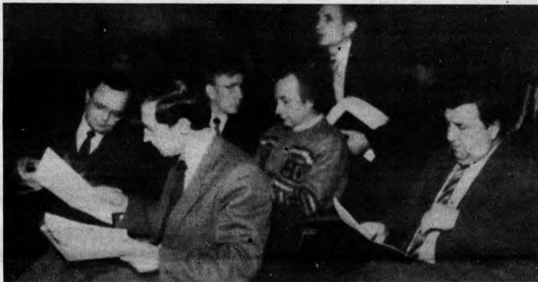
На конференции во время принятия Устава КГТУ.