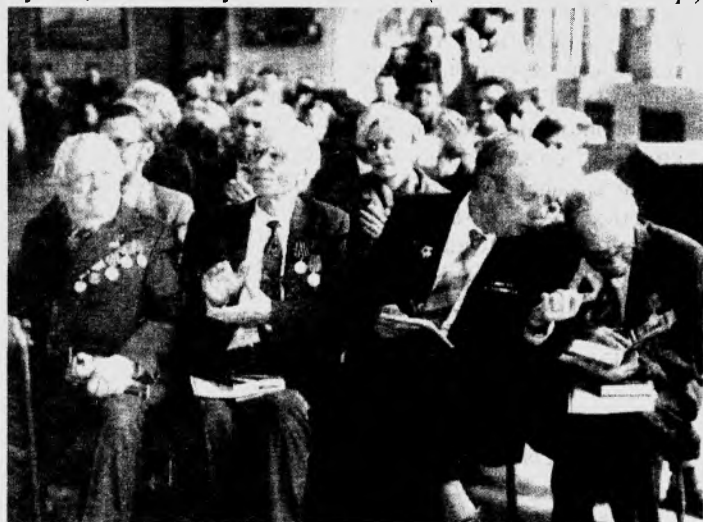
Наши ветераны на торжественном собрании по случаю Дня Победы.