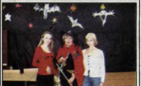
Студентам ФИПУ по душе и Halloween и Christmas show.