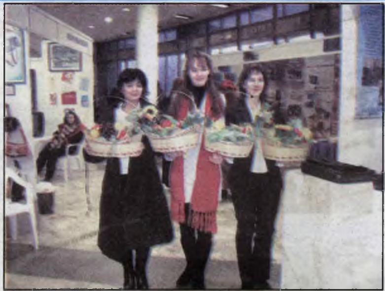
Студентки Института информатизации социальных систем