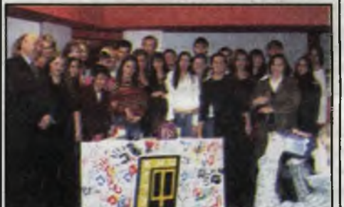
Самое необычное посвящение в студенты.