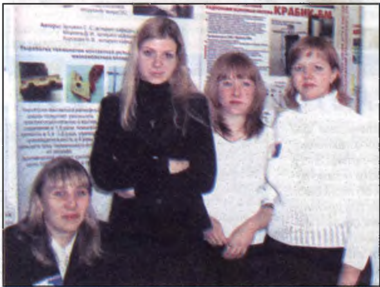
Экспозиция молодежного инновационного центра

го инновационного центра КГТУ в интересах муниципалитета.