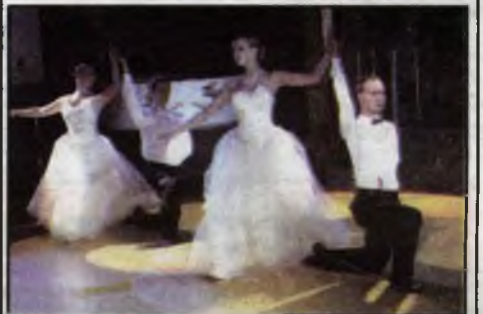
По всем канонам бального этикета встретили Новый год молодые ученые и аспиранты.