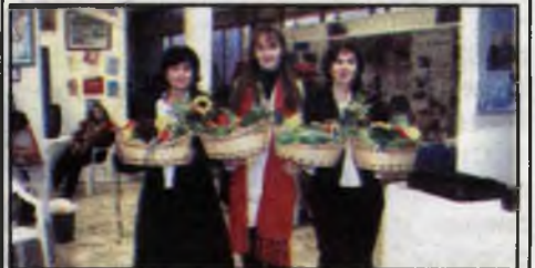
Молодёжный центр КГТУ – участник форума «Красноярск – город инноваций, партнерства и согласия»