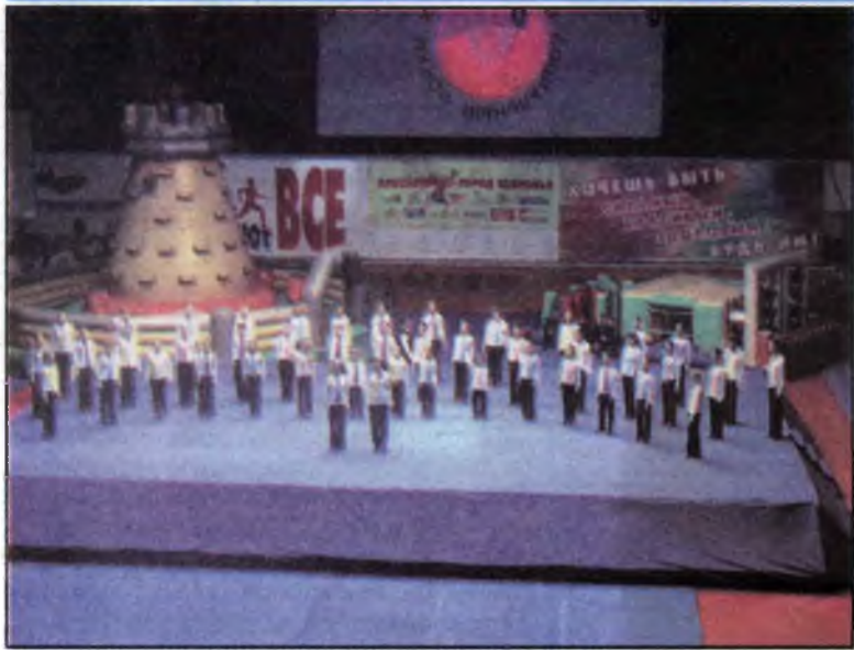
Торжественное открытие социального форума в Красноярске

КГТУ принял активное участие в социальном форуме "Красноярск - город инноваций, партнерства и согласия".