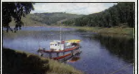
Тихая заводь на Убее: странички из дневника студента.