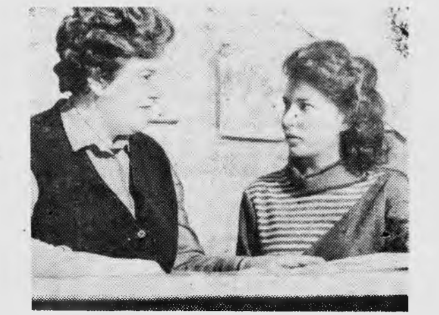
с несовершеннолетними результатами рейда.